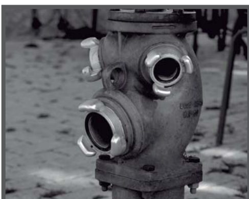
2017 ENLLUMENAT I HIDRANTS

Aquesta zona pretén obrir, inicialment, els mesos de temporada alta (abril a octubre).