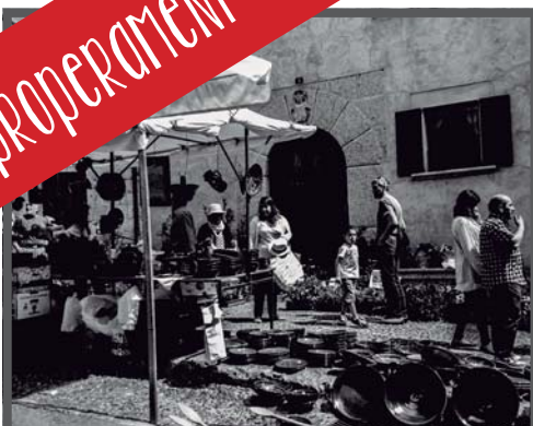
2017 MERCAT ARTESÀ